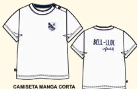
CAMISETA MANGA CORTA